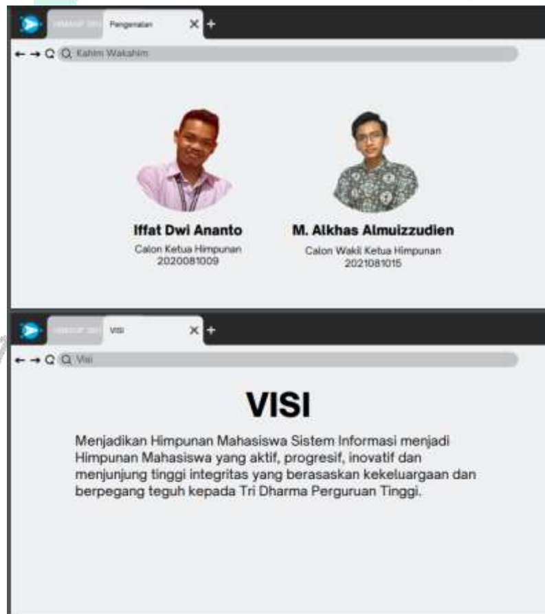
Gambar 3. 2 Dokumen Sosialisasi Kampanye Calon Ketua HIMASIF.

Pada pemaparan sosialisasi kampanye yang dilakukan oleh calon ketua dan wakil ketua himpunan mahasiswa sistem informasi di Universitas Pembangunan Jaya menghasilkan dokument PowerPoint sebagai bentuk pemaparan visi, misi, struktur organisasi, proyek kerja, dan kegiatan yang akan dilakukan selama masa jabatan calon ketua himpunan mahasiswa sistem informasi. tampilan ini bisa dilihat pada Gambar 3.2 dibawah.