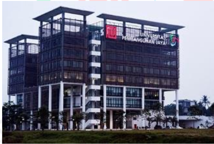
Gambar 2.1 Gedung Universitas Pembangunan Jaya

Universitas Pembangunan Jaya (UPJ) adalah sebuah perguruan tinggi swasta di daerah Bintaro yang berdiri pada tahun 2011 dan didukung oleh kelompok usaha Pembangunan Jaya. Kelompok usaha Pembangunan Jaya memiliki 17 usaha yang bergerak dibidang properti, manufaktur, konsultan manajemen, konsultan desain, kontraktor, pariwisata/rekreasi, trading, mekanikal & elektrikal dan pendidikan. Kelompok usaha Pembangunan Jaya memiliki pengalaman lebih dari 50 tahun dalam mengelola sektor usaha dan beritikad untuk mengabdikan sebagian dari kegiatan usaha induknya ke pendidikan dalam membangun sumber daya manusia Indonesia yang lebih berkualitas.