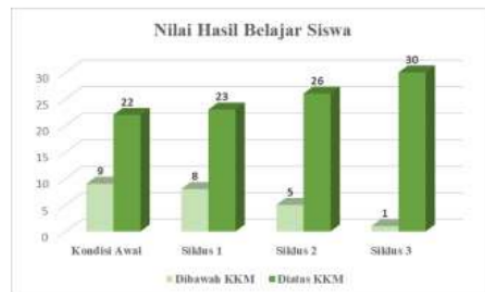
Gambar 4: Nilai Hasil Belajar

Rata-rata tiap siklus mengalami peningkatan. Pada kondisi awal nilai rata-rata hasil belajar siswa adalah 79,68, siklus pertama 84,19, siklus kedua 87,42, dan siklus ketiga 94,52. terdapat perubahan dari kondisi awal, siklus pertama, kedua, dan ketiga. Nilai hasil belajar yang di atas KKM pada kondisi awal adalah 70,97%, siklus pertama 74,19%, siklus kedua 83,87%, dan siklus ketiga 96,77%. Data pada grafik tersebut memperlihatkan bahwa siswa kelas IIA yang memperoleh nilai sama dengan atau di atas KKM sudah mencapai 90%.