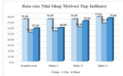
Gambar 3: Rata-rata Nilai Sikap Motivasi Belajar di setiap Indikator

Berdasarkan hasil penelitian pada siklus pertama, kedua, dan ketiga ada beberapa perubahan nilai rata-rata pada sikap motivasi belajar siswa. Pada kondisi awal nilai rata-rata sikap motivasi belajar siswa adalah 60,22, siklus pertama 61,02, siklus kedua 66,13, dan siklus ketiga 71,77. Rata-rata indikator satu – tekun menghadapi tugas, pada kondisi awal, siklus pertama dan siklus kedua adalah 73,39, sedangkan siklus ketiga 77,42. Pada kondisi awal hingga siklus kedua tidak ada perubahan nilai rata-rata sikap motivasi belajar siswa. Nilai rata-rata indikator dua – ulet menghadapi kesulitan mengalami peningkatan pada setiap indikator. Indikator dua pada kondisi awal 50,00, siklus pertama 52,42, siklus kedua 59,68, dan siklus ketiga 66,13. Rata-rata indikator tiga – menunjukkan minat terhadap pelajaran Matematika, pada kondisi awal adalah 57,26, siklus pertama 58,06, siklus kedua 70,16, dan siklus ketiga 75,00. Rata-rata indikator tiga juga sama dengan indikator dua, pada indikator ini terdapat peningkatan pada setiap siklus.