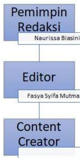
Gambar 2. 5 Struktur Organisasi Kompres

Struktur organisasi departemen di Kompres UPJ digambarkan pada gambar di atas. Dalam pengaturan ini, Ibu Naurissa Biasini menjabat sebagai pemimpin redaksi KOMPRESS dan kak Fasya Syifa sebagai editor KOMPRESS yang menduduki peringkat kedua, disusul jajaran praktisi yang berprofesi sebagai content creator .