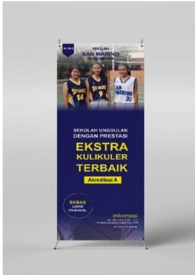
Gambar 4. Desain X-Banner.