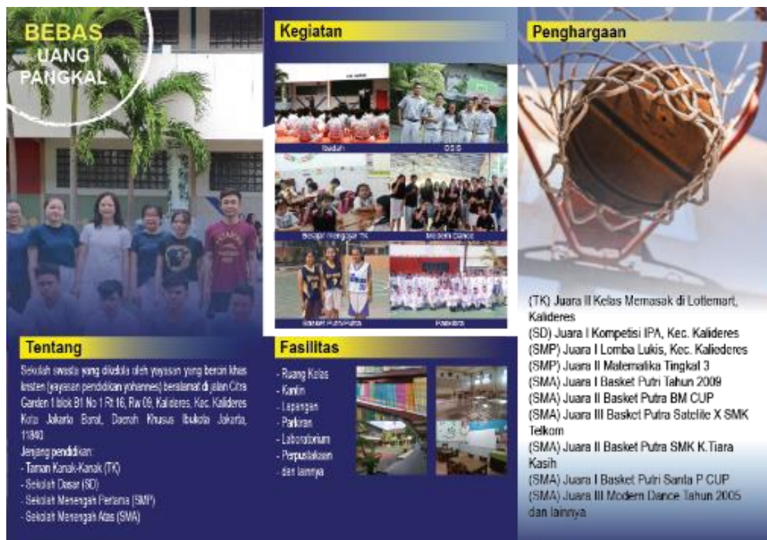
Gambar 3. Desain Brosur Tampak Belakang.