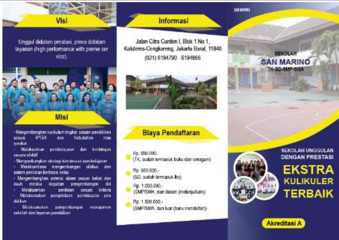
Gambar 2. Desain Brosur Tampak Depan.