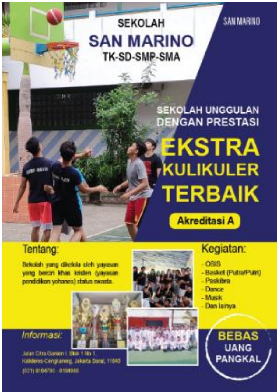
Gambar 1. Desain Flyer

Langkah yang perlu dilakukan pertama sebelum melakukan pengerjaan adalah menentukan pendekatan desain, yaitu dimana membuat desain yang baik dengan mengolah unsur garis atau bidang, dan menggunakan beberapa variasi warna. Media promosi menggunakan bahasa yang mudah dimengerti sehingga dapat dipahami semua kalangan masyarakat. Target sasaran atau sasaran dari perancangan media promosi ini yaitu keluarga dari calon peserta didik baru dan juga calon peserta didik baru itu sendiri.