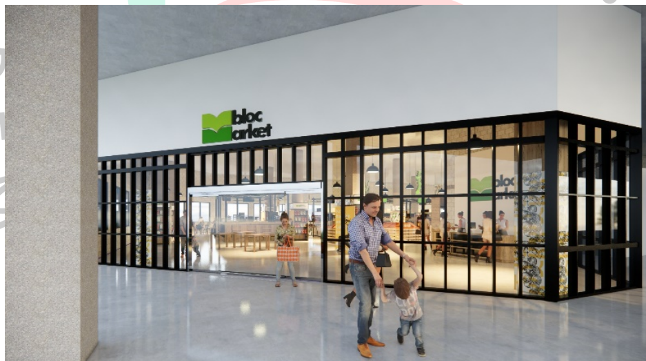
Gambar 2. 3 Shopfront Mbloc Market Semarang

Sebagai perusahaan retail yang saat ini sedang berkembang, kegiatan umum dari Mbloc Market adalah dengan menjual produk-produk lokal yang berasal dari seluruh bagian Indonesia. Dari kegiatan tersebut juga Mbloc Market akan melakukan pembangunan toko yang akan tersebar di seluruh penjuru Indonesia. Dalam hal ini praktikan akan membahas salah satu proyek supermarket milik Mbloc Market berkonsep interior Rustic yang saat ini sedang direncanakan yaitu Mbloc Market Semarang.