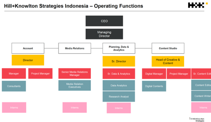
Gambar 2.4 Struktur Organisasi - Fungsi Operasi

Struktur organisasi dibagi menjadi 2 bagian yaitu Fungsi Operasi ( Operating Functions ) dan Fungsi Pendukung ( Operating Functions ). Fungsi operasi merupakan bagian-bagian atau departemen-departemen yang bertanggung jawab untuk merencanakan, menjalankan, dan memberikan layanan kepada klien. Pada fungsi operasi terdapat 4 departemen atau divisi yaitu Account , Media Relations , Planning, Data And Analytics , serta Content Studio .