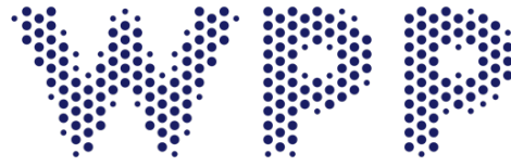
gambar 2 .2 WPP plc

Dilansir dari (Funding Universe, n.d.), pada tahun 1987, JWT Group beserta anak perusahaannya yaitu Hill+Knowlton Strategies dan Lord Geller Federico & Einstein di akuisisi oleh perusahaan multinasional asal Inggris yang bergerak dibidang komunikasi, pemasaran, teknologi dan periklanan bernama WPP plc. Pada tahun 2019, WPP plc dinobatkan sebagai perusahaan advertising terbesar di dunia dengan anak perusahaan berupa agensi-agensi terbesar seperti Hill+Knowlton Strategies, Ogilvy, Wunderman+Thompson, Mindshare, Mediacom dan Wavemaker.