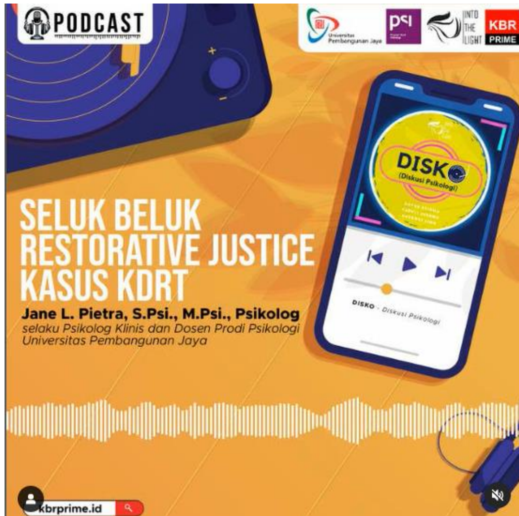
Figure 2 Podcast KBR – Psikologi UPJ

Pertanyaan-pertanyaan yang masuk merupakan pertanyaan dari para pendengar KBR yang telah terlebih dahulu masuk melalui website maupun media sosial KBR serta disunting oleh pembawa acara. Peneliti sebagai narasumber menjawab pertanyaan-pertanyaan tersebut sesuai dengan bahan dan kerangka teori yang telah ditemukan sebelumnya dalam tahap persiapan.