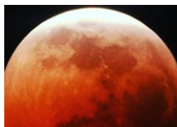
Foto : Kegiatan Pengamatan Gerhana Bulan Total SSC Pembangunan Jaya