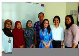
Seminar Pendidikan Majapahit Nusantara Secondary School: How to Build Critical Thinking