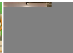
APP Sinar Mas Raih Penghargaan Edukasi Pasar Terbaik Lewat "Festival Penulis Cilik SiDU"