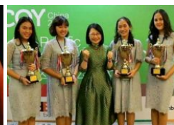
Cara Sukses Mendidik Anak Agar Memiliki Mental Juara