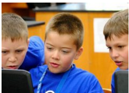
Brain Exercise : The Power of Making Games