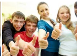
Tips Menjadi Remaja yang Aktif dan Sukses