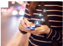
Cara Mudah dan Ramah Bermedia Sosial