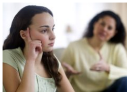
Remaja dan Orang Tua: Mari Berkomunikasi