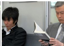
Generational Gap: Bagaimana Cara Mengatasinya?