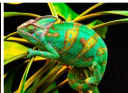
Apakah Kita Mampu Efektif Menyesuaikan Diri?