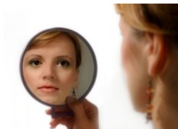
Evaluasi Diri dengan Segenap Hati