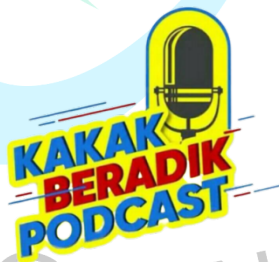
Gambar 2.3 Logo Program Kakak Beradik Podcast

Kakak Beradik Podcast merupakan salah satu program unggulan yang ada di MOP Channel yang di mana program ini mempunyai tema podcast horror setiap hari Kamis. Kakak Beradik Podcast bukan hanya podcast biasa melainkan dikemas seunik mungkin sehingga beda dengan podcast horror lainnya. Salah satu hal yang membuat Kakak Beradik Podcast berbeda dengan podcast lainnya yakni podcast ini disiarkan langsung selama 2 jam tanpa jeda setiap Kamis pukul