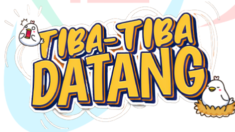
Gambar 2.6 Logo Program Tiba – Tiba Datang

Tiba – Tiba Datang merupakan salah satu program baru yang ada di MOP Channel. Pada program ini, host akan datang ke rumah milik bintang tamu lalu akan membangunkan bintang tamu dari tidur dan mengetahui kegiatan apa saja yang dilakukan oleh bintang tamu saat pagi hari dari bangun tidur hingga beraktifitas. Program ini memiliki tagline yakni “Tiba – Tiba Datang? Kukuruyukkk” yang di mana tagline ini menjadi ciri khas dan menjadi satu hal yang menonjol dari program ini.