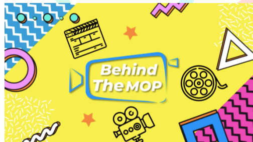
Gambar 2.8 Logo Program Behind The MOP

Behind The MOP merupakan salah satu program MOP channel yang dimana berbeda dengan program – program lainnya, karena pada program ini yang akan di rekam dan di pandu oleh crew yang dimana nantinya yang akan tayangkan adalah bagaimana keseruan crew dan juga proses shooting program – program yang ada di MOP Channel.