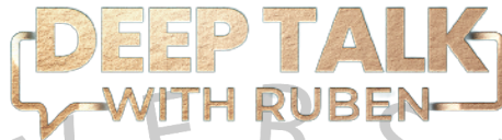
Gambar 2.5 Logo Program Deep Talk With Ruben

Deep Talk With Ruben merupakan salah satu program yang ada di MOP Channel. Program ini merupakan program talk show dengan obrolan yang berat. Program ini dipandu dengan host Ruben Onsu dan akan mengundang bintang tamu yang akan mengobrol secara mendalam. Program ini ditayangkan setiap hari Rabu pukul 19.00 WIB.