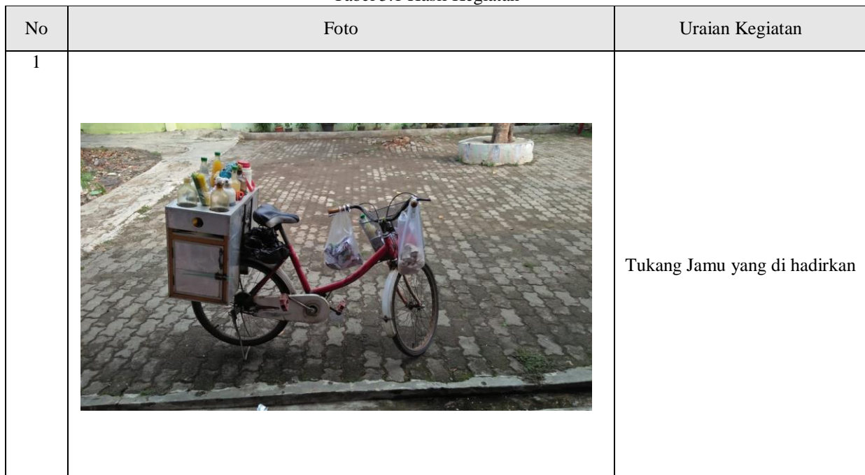
Tabel 5.1 Hasil Kegiatan

Hasil Kegiatan Teknik Sipil dalam Kehidupan Masyarakat diabadikan pada Tabel 5.1 sebagai berikut :