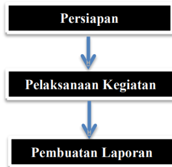
Gambar 3.1. Diagram Alur Tahap Pelaksanaan Pengabdian kepada Masyarakat

Metode pelaksanaan pada program pengabdian kepada masyarakat ini yaitu pengusul melakukan observasi di lingkungan sekitar Universitas Pembangunan Jaya untuk mendapatkan tempat pendidikan yang layak untuk direnovasi. Adapun tahapan pelaksanaan program yaitu sebagai berikut: