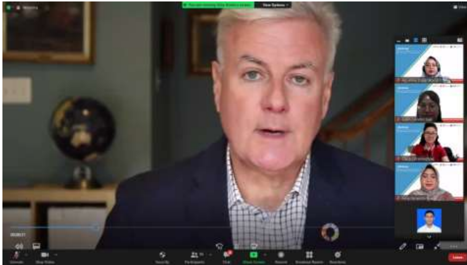
Gambar 2. Sebanyak 103 Peserta Mengikuti Webinar Scalling Up Your Bussiness: Pieces of Advice for Small and Medium-Sized Enterprises