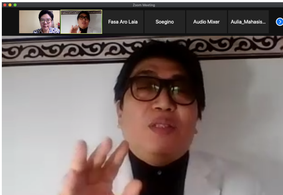
Figure 2 Kegiatan Radio Talks Elshinta

Peserta juga pada akhirnya menyadari bahwa memang ada dampak terselubung dari pandemi COVID-19 serta mengetahui berbagai cara praktis yang dapat menurunkan kecemasan.