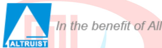
Gambar 2.2 Logo Altruist Technologies

Altruist Technologies Pvt Ltd telah mengukuhkan dirinya sebagai pemimpin industri dengan memberikan solusi telekomunikasi yang andal, inovatif, dan efisien bagi pelanggan mereka. Dengan jangkauan global dan mitra bisnis yang luas, mereka terus berinovasi dan mengembangkan produk dan layanan mereka untuk menjawab tantangan dan kebutuhan yang terus berkembang di industri telekomunikasi.