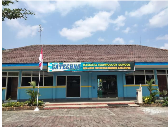
Gambar 2. Tampak Luar Bangunan SMK Gamaliel 1 Madiun

Untuk itu maka diperlukan beberapa kegiatan: