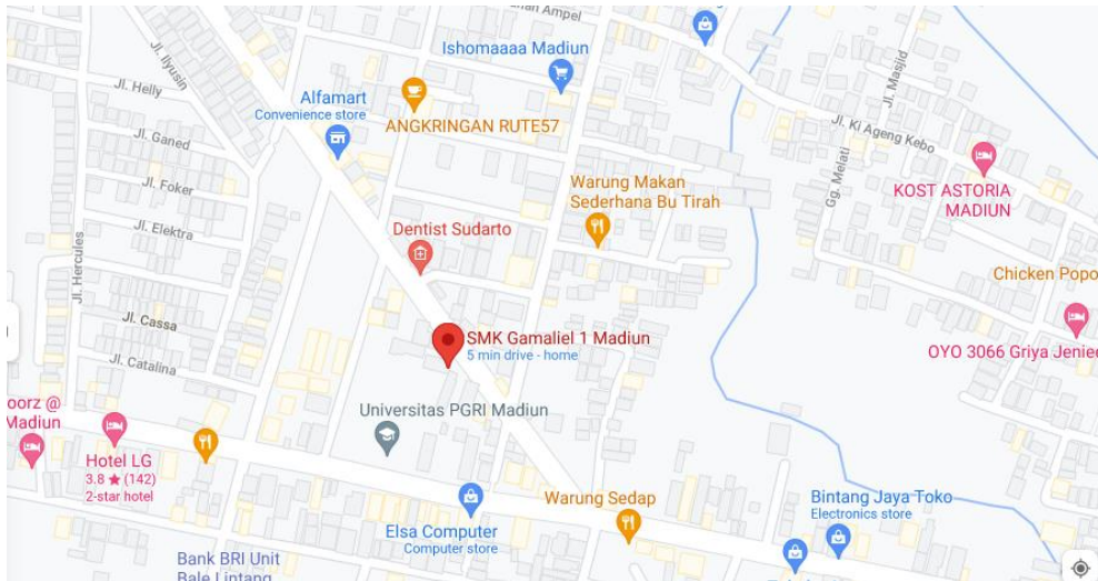
Gambar 1. Lokasi SMK Gamaliel 1 Madiun

Sekolah SMK Gamaliel 1 Madiun terletak di Jalan Slamet Riyadi. Terletak dengan dengan Universitas PGRI Madiun. Letaknya yang berdekatan dengan beberapa Universitas dan Sekolah Tinggi merupakan tantangan tersendiri. Diharapkan SMK Gamaliel 1 Madiun dapat bersaing dengan citra kawasan Pendidikan.