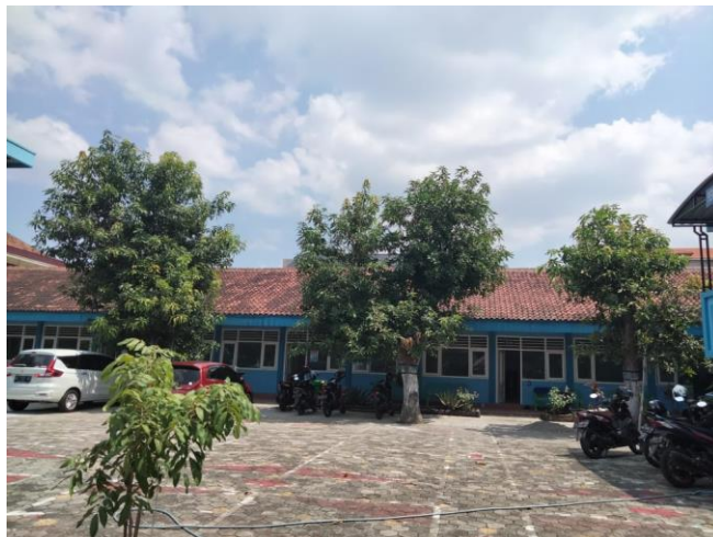
Gambar 3. Tampak Dalam Bangunan SMK Gamaliel 1 Madiun

Tim Pengmas UPJ akan melakukan survei dan analisis kawasan. Setelah itu kita memberikan usulan desain dan apabila diperlukan untuk memberikan perhitungan RAB kita akan susulkan. Melakukan desain branding dengan Tampak Bangunan yang diusulkan. Memberikan visualisasi Kawasan yang baik dan bisa digunakan untuk keperluan marketing.