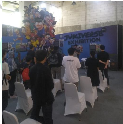
Gambar 3.9 Pengawasan pada event

Dalam tugas ini praktikan tidak melakukan tugas di kantor, tetapi terjun langsung ke lapangan bersama pembimbing kerja, yang mana kami melihat secara langsung bagaimana berjalannya event. Melakukan observasi terhadap pemimpin tim yang ada dilapangan apakah ada kendala dan para pekerja apakah bekerja dengan baik.