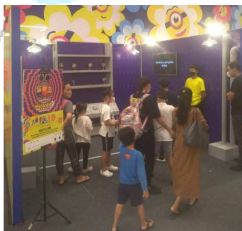
Gambar 3.4 Pengawasan kepada tim

Gambar 3.3 Merupakan kegiatan praktikan pada menjadi pemimpin tim saat melakukan pengawasan kepada tim