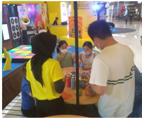
Gambar 3.3 Pengawasan kepada tim

pembekalan sebagaimana harus bekerja sesuai dengan standar operasional prosedur (SOP) perusahaan maupun mall, bersama dengan tim melakukan identifikasi pengunjung yang berada pada mall tersebut untuk dapat menghadapi pengunjung harus memiliki sikap seperti apa sesuai dengan karakter pengunjung, melakukan pengawasan pada tim supaya dapat bekerja dengan baik dan benar agar meminimalisir kesalahan yang terjadi. Menjadi contoh pada tim dalam berperilaku baik dan komunikasi yang dapat dimengerti satu sama lain, membantu tim jika mengalami kesulitan dalam bekerja, menjadi penghubung dan menjadi garda terdepan jika tim melakukan kesalahan dalam menghadapi karyawan kantor maupun karyawan mall.