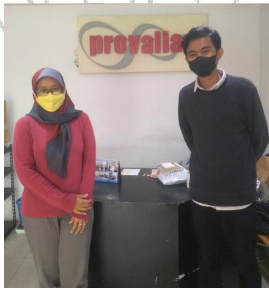
Gambar 3.1 Praktikan Bersama pembimbing kerja

membimbing praktikan selama melakukan KP. Ketika praktikan sudah bertemu dengan pembimbing kerja melakukan kesepakatan mengenai peraturan yang berlaku selama pelaksanaan KP agar dapat berjalan dengan lancar sesuai dengan capaian mata kuliah yang diadakan oleh pihak kampus. Praktikan selanjutnya diajak oleh pembimbing kerja untuk diperkenalkan kepada karyawan PT Provaliant Licensing Succes agar mempermudah urusan pekerjaan, baik antara praktikan terhadap karyawan maupun karyawan terhadap praktikan.