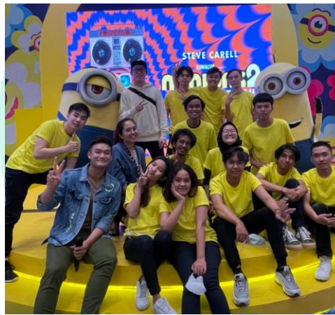
Gambar 3.2 Praktikan Bersama tim event