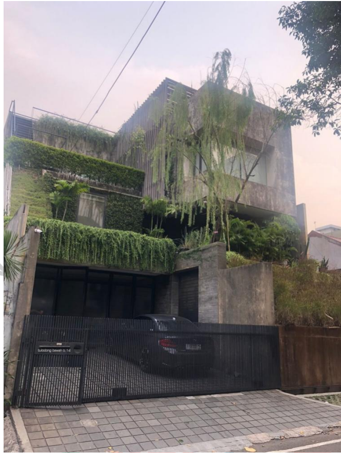
Gambar 1.3 Kantor Nature Habitat Jakarta