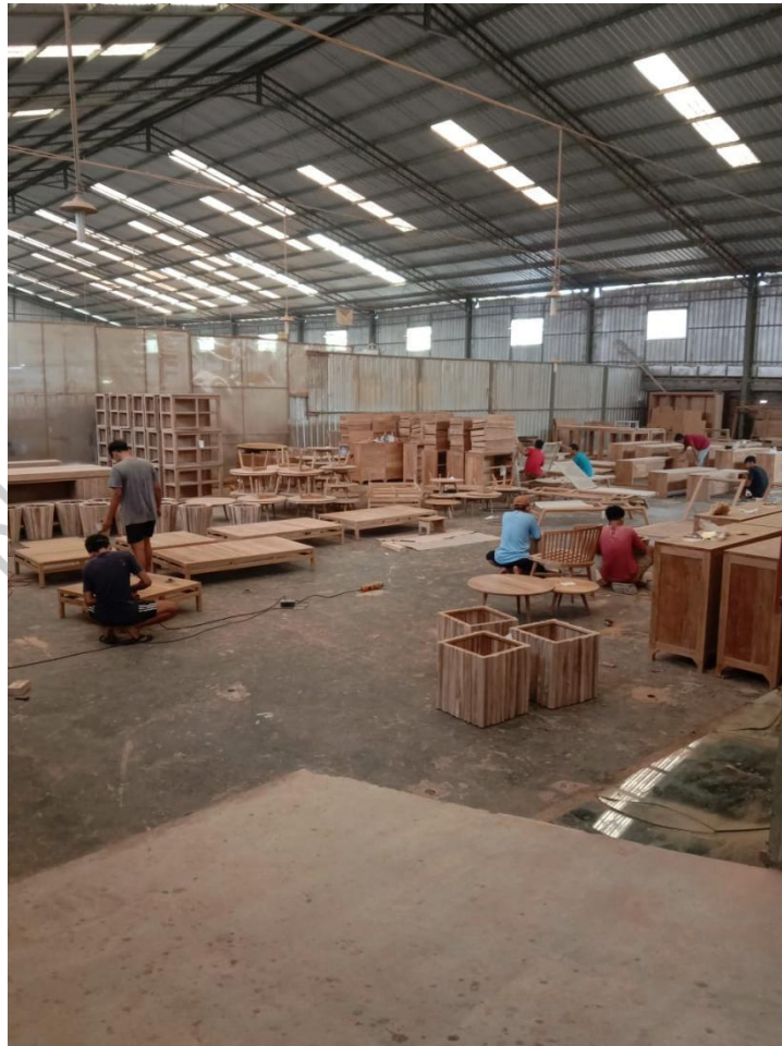
Gambar 1.2 Area Final Nature Habitat