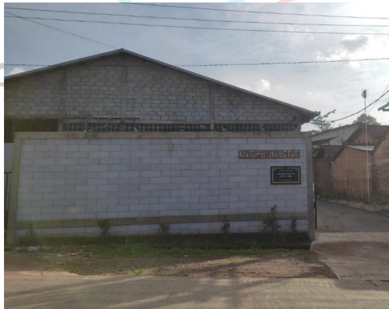
Gambar 1.1 Pabrik Nature Habitat