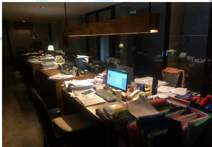
Gambar 1.4 Ruang Kerja Praktikan