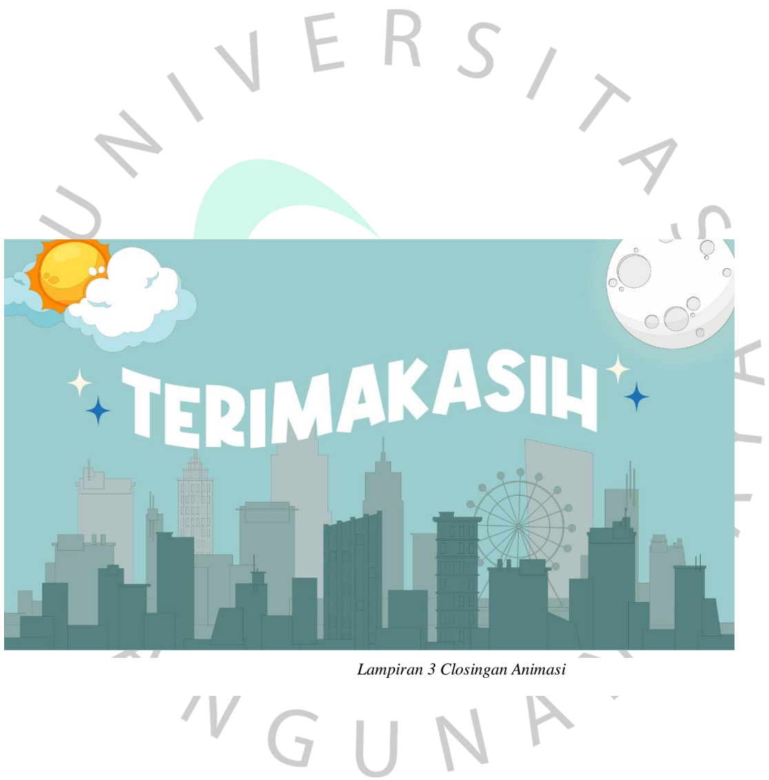
Lampiran 3 Closingan Animasi