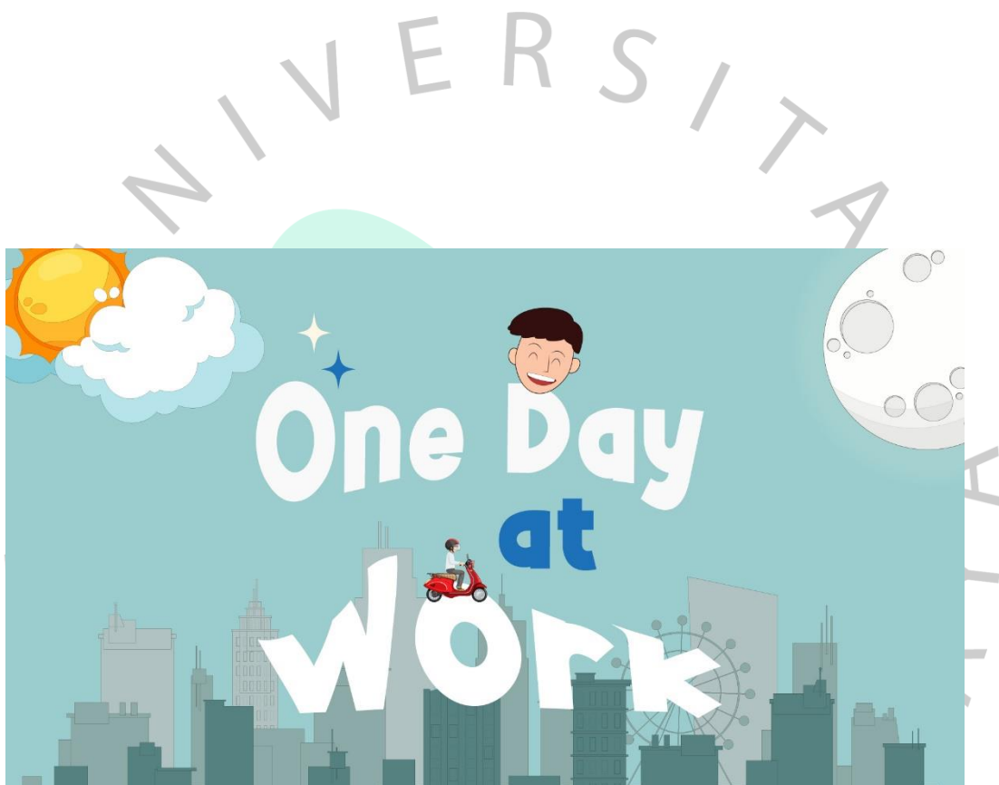
Lampiran 2 Opening Animasi