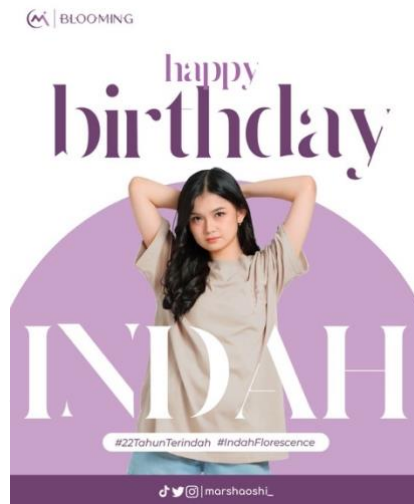
Gambar 4.10 Appreciation Post Content

Untuk konten yang bersifat memberikan ucapan selamat ulang tahun kepada member JKT48 lainnya seperti contoh gambar diatas. Unggahan ini dibuat dengan simple tapi informatif agar informasi yang disampaikan tidak terlihat rumit agar yang melihat unggahan ini tahu mengenai informasi yang disampaikan terkait pesannya. Untuk detil tentang unggahan dijelaskan lebih banyak melalui caption.