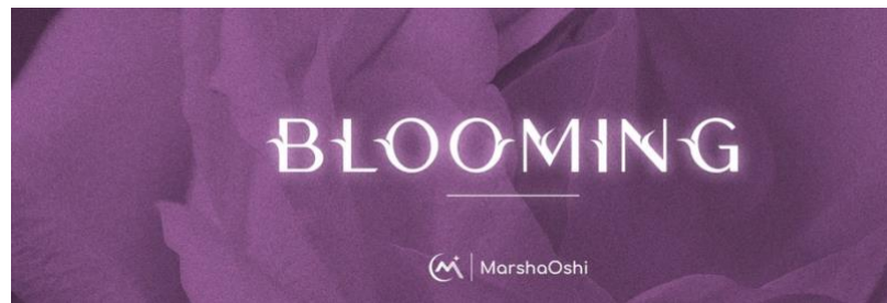
Gambar 4.4 Tagline MarshaOshi

MarshaOshi juga memiliki tagline untuk identitas fanbase . Tagline yang Bernama Blooming berarti mekar dan tumbuh. Tagline ini dibuat dengan doa dan harapan bahwa Marsha Lenathea dan MarshaOshi akan tumbuh dan mekar bersama.