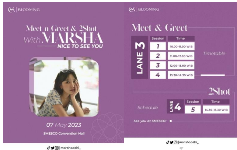
Gambar 4.8 Monthly Post Content

Untuk konten yang bersifat acara khusus atau spesial, biasa diisi dengan kegiatan seperti konser, tour atau meet and greet, seperti contoh konten diatas adalah konten informasi jadwal meet and greet dan 2 shot foto bersama, informasi yang ditampilkan adalah jadwal dan jalur meet and greet. Unggahan ini dibuat dengan simple tapi informatif agar informasi yang disampaikan tidak terlihat rumit agar yang melihat unggahan ini tahu mengenai informasi yang disampaikan terkait kegiatannya.