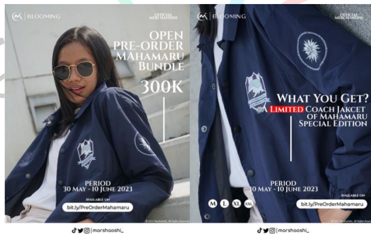
Gambar 4.13 Merchandise Post Content