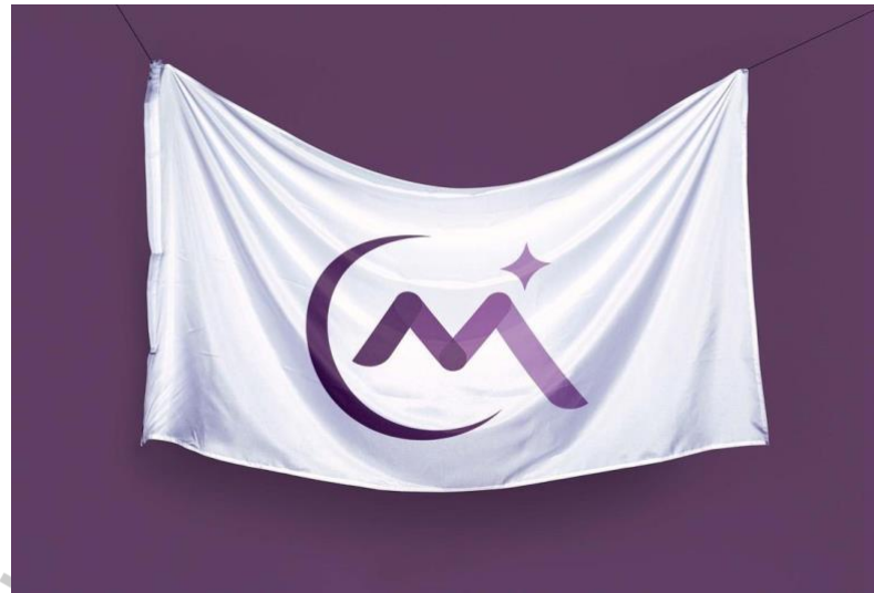
Gambar 4.2 Logo Fanpage MarshaOshi