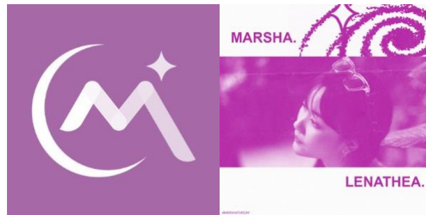
Gambar 4.16 Merchandise Photocard

Untuk merchandise gratis ada Stiker yang dikonsep menjadi dua dengan berisi foto Marsha dengan desain khusus dan logo MarshaOshi. Dirilis nya stiker ini dikarenakan mudah untuk disimpan dan kemudian ditempelkan seperti di Lemari atau Meja. Dibuat dengan tema yang sudah ditentukan sesuai dengan identitas dari MarshaOshi.