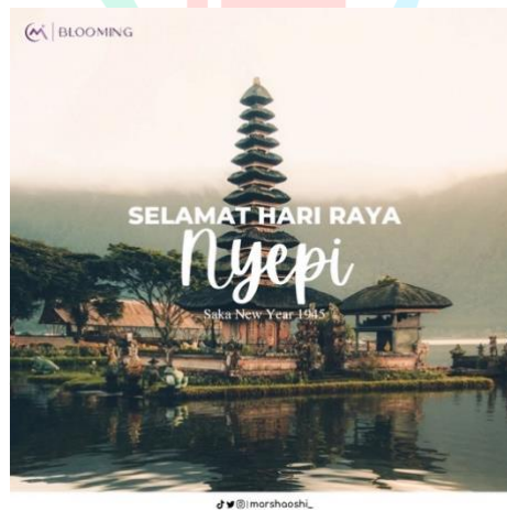
Gambar 4.11 Holiday Post Content

Untuk konten yang bersifat memberikan ucapan hari besar seperti contoh gambar diatas. Konten ini dibuat agar menyimbolkan sifat toleransi yang dimiliki fanbase MarshaOshi. Unggahan ini dibuat dengan simple tapi informatif agar informasi yang disampaikan tidak terlihat rumit agar yang melihat unggahan ini tahu mengenai informasi yang disampaikan terkait pesannya. Untuk detil tentang unggahan dijelaskan lebih banyak melalui caption.