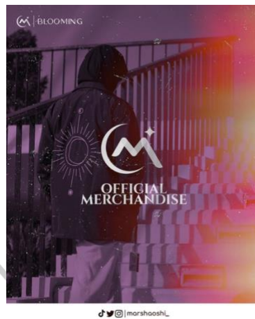
Gambar 4.12 Merchandise Post Content

Sebagai Media Pendukung untuk Kampanye dan Promosi MarshaOshi, diluncurkan juga nantinya untuk merchandise untuk menyebarkan lagi fanbase ini ke khalayak yang lebih banyak, untuk perilsan merchandise, beberapa ada yang dijual dan dibagikan secara gratis, dengan tema yang sudah ditentukan sesuai dengan identitas dari MarshaOshi.