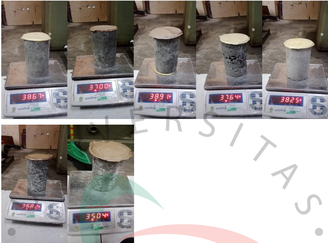
Lampiran A- 3 Dokumentasi Uji Agregat