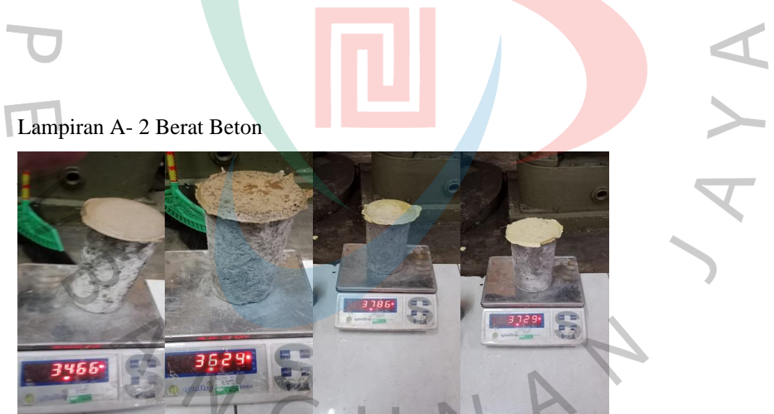
Lampiran A- 2 Berat Beton