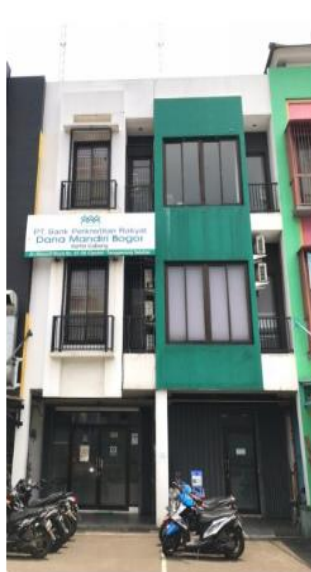
Kantor Cabang Tangerang Selatan

Ruko Harvest Bintaro Residence No. 27-28, Jl. Merpati Raya Ciputat Tangerang Selatan Propinsi Banten 15413