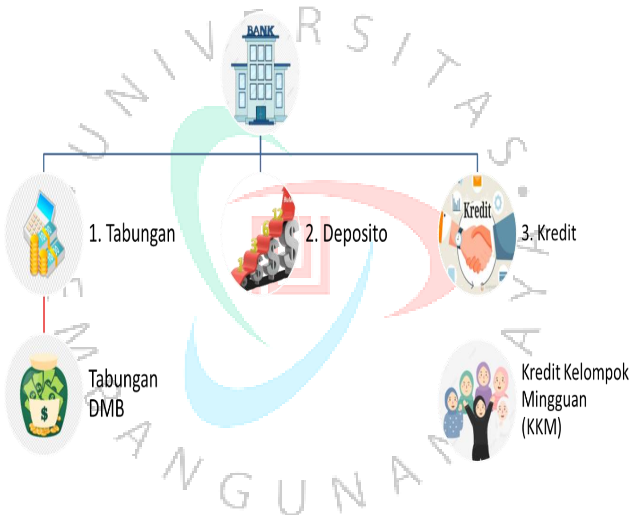
Gambar 2.6 Fokus dan Produk PT. BPR Dana Mandiri Bogor

Aktivitas yang dilaksanakan dalam PT. BPR Dana Mandiri Bogor Melakukan penghimpunan dana Simpan Pinjam, dengan Produk tabungan, Deposito, Kredit.