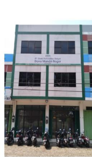
Kantor Cabang Cianjur

Jl. Raya Cikukulu RT. 019 RW. 005 Desa Cisande Kecamatan Cicantayan Kabupaten Sukabumi Propinsi Jawa Barat 43155