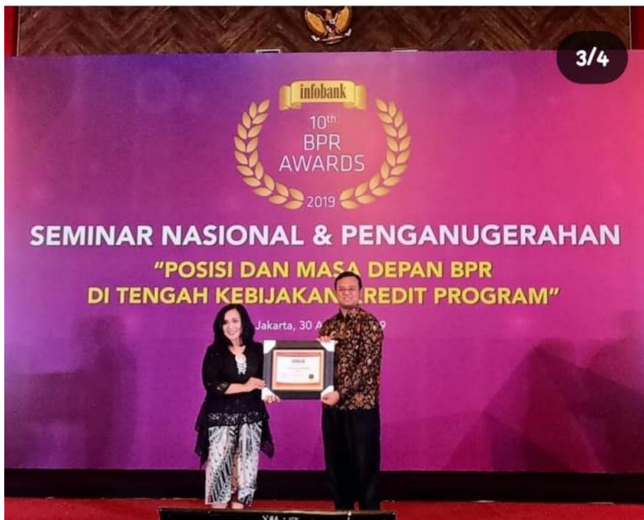
Gambar 2.3 Penyerahan Penghargaan dari InfoBank