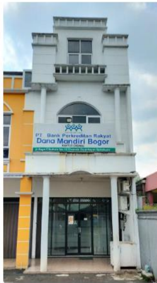
Kantor Cabang Sukabumi

Ruko Harvest Bintaro Residence No. 27-28, Jl. Merpati Raya Ciputat Tangerang Selatan Propinsi Banten 15413