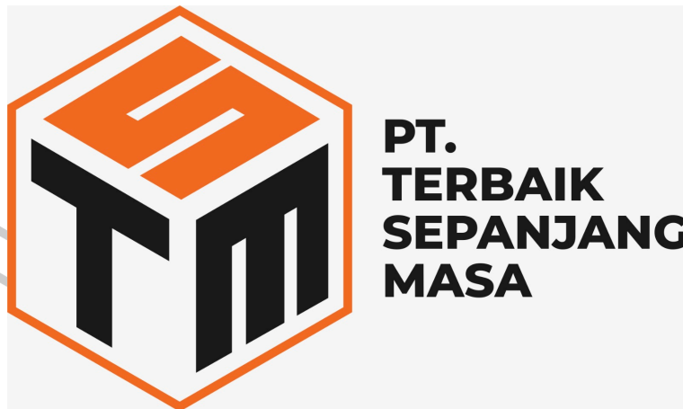
Gambar 1.1 Logo Perusahaan