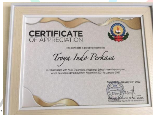
Gambar 2. 2 Prestasi Bisnis Unit Troya Indo

Adapun bisnis unit PT MM Corporation yang telah mendapatkan prestasi adalah PT Troya Indo Perkasa dengan mendapatkan penghargaan Certificate of Appreciation .