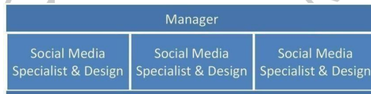
Gambar 2. 4 Struktur Organisasi Trimedia Mulia Perkasa