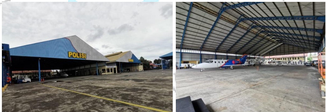
Gambar 1.3 Hangar Pesawat Polisi Udara

Base Maintenance PT. Trisjunar Mega Radha berlokasi di Hangar Lanudal TNI-AL, Bandar Udara Pondok Cabe. Pondok Cabe Ilir Kota Tangerang Selatan- Banten.