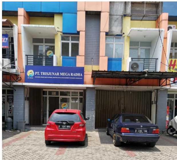
Gambar 1.1 Head Office PT Trisjunar Mega Radha

PT Trisjunar Mega Radha didirikan pada tanggal 22 maret 2017, dengan bidang usaha perawatan dan perbaikan pesawat terbang dan helikopter. PT. Trisjunar Mega Radha sendiri mempunyai pengalaman dalam bidang perawatan dan perbaikan pesawat dengan berbagai jenis dan type. Hingga saat ini PT. Trisjunar Mega Radha memiliki tenaga ahli dan peralatan khusus untuk perawatan dan perbaikan pesawat dan helikopter dan didukung pula sertifikat bidang perawatan pesawat dari Direktorat Kelaikudaraan dan Pengoperasian Pesawat Udara (DKPPU) kementerian perhubungan RI dengan nomor 145d-990. Adapun pelanggan dari PT. Trisjunar Mega Radha diantaranya : Pusat Penerbangan TNI AD, Pusat Penerbangan TNI AL, Polisi Udara, Badan Pencarian dan Penyelamatan Nasional (BASARNAS). PT Trisjunar Mega Radha juga didukung oleh beberapa vendor dan pabrikan suku cadang pesawat dan helikopter. PT. Trisjunar Mega Radha juga mempunyai kapasitas sebagai konsultan penerbangan.