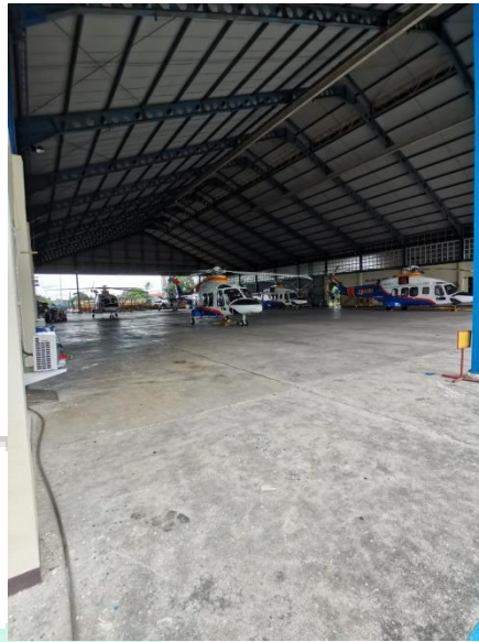
Gambar 1.4 Hangar Helikopter Polisi Udara