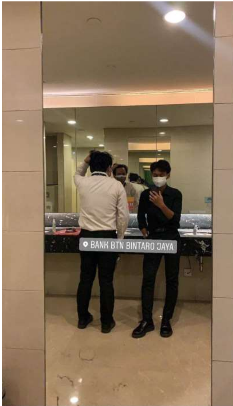
Lampiran 2.2. Praktikan Saat Melakukan Bimbingan Dengan Pembimbing Kerja dan Rapat Mingguan Bersama Tim Beserta Rekan Kerja