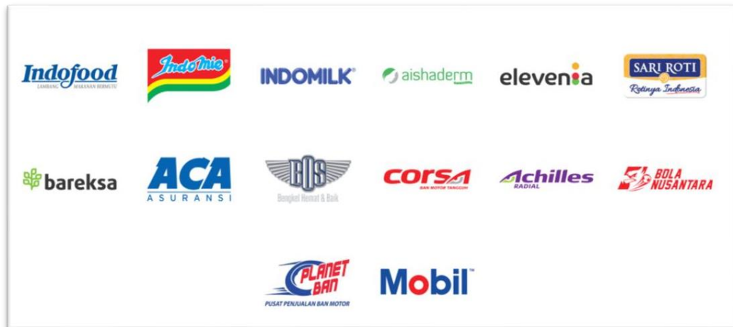
Gambar 2. 1 Klien dari Bali United Creative

dan Bali saja. Namun, untuk Ke depannya perusahaan United Creative juga akan merencanakan program ekspansi ke beberapa wilayah Jawa Barat, Jawa Timur, Nusa Tenggara Barat, dan Nusa Tenggara Timur, agar perusahaan ini dapat terus berkembang dan meluas.