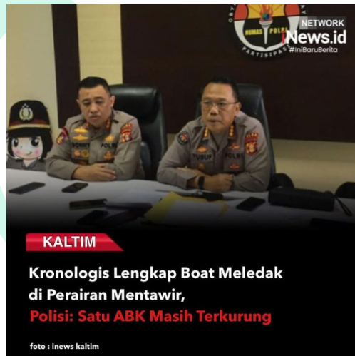
3.1 Postingan Instagram Inews Network

Pada praktik kerja ini juga praktikan yang awal dalam membuat tiktok dan instagram dari inews network, Karena sebelumnya inews network hanyalah sub berita online dari inews.id . inews.id merupakan kanal berita per daerah yang ada di Indonesia.