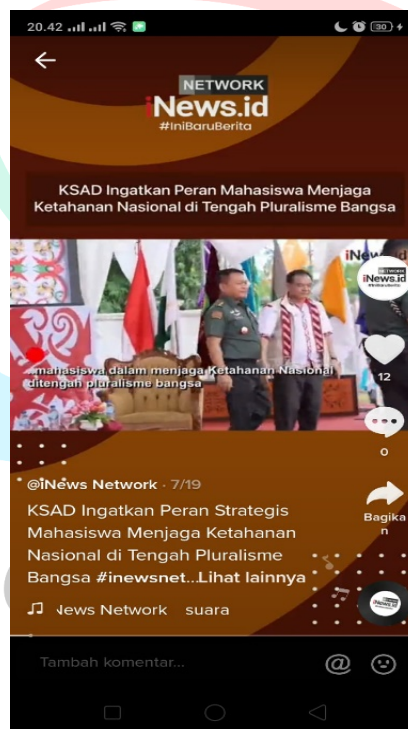
3.3 Postingan Tiktok Inews Network

Setelah melakukan editing praktikan mengirimkannya kepada pembimbing kerja profesi, untuk dilihat apakah ada kesalahan atau konten sudah layak untuk di upload. Jika dirasa tidak ada revisi maka praktikan langsung mengupload konten pada TikTok Inews Network.