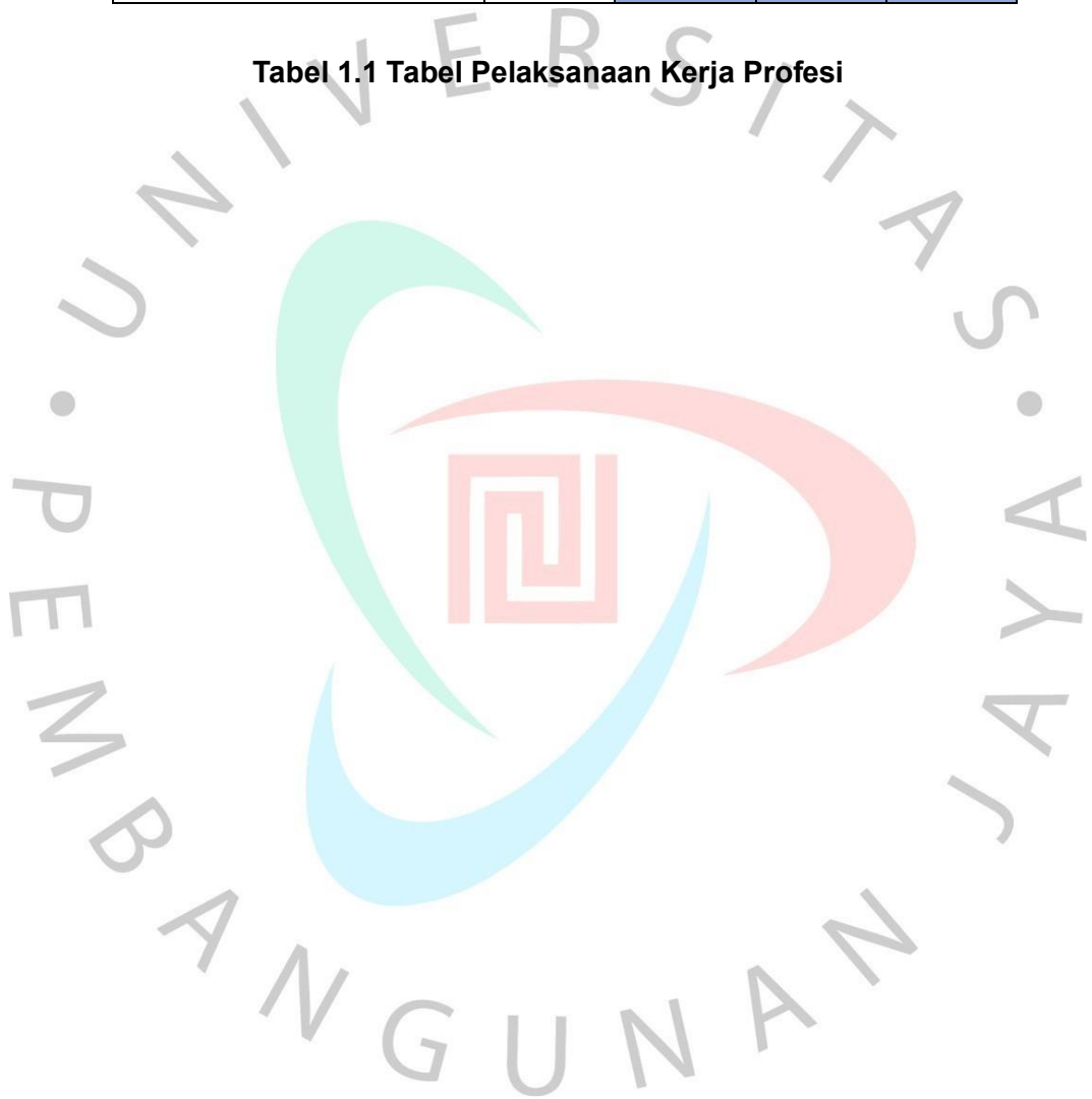
Tabel 1.1 Tabel Pelaksanaan Kerja Profesi