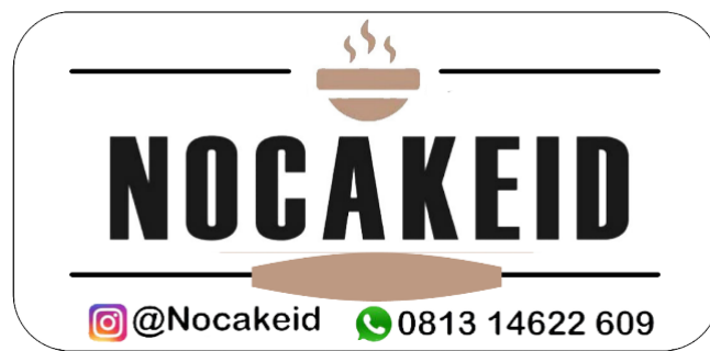
Gambar 2.1 Logo Nocakeid