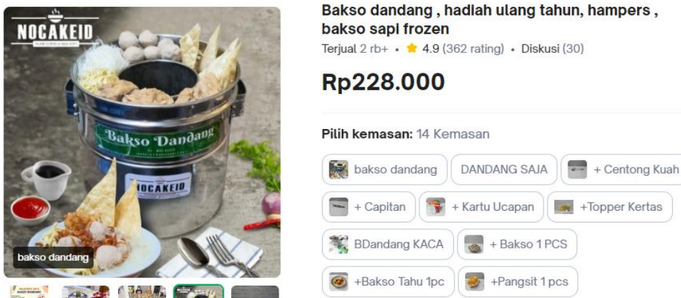
Gambar 2.2 Produk Bakso Dandang pada Tokopedia

Dalam memasarkan produknya nocakeid berfokus pada media online yaitu dengan mengenalkan produknya melalui Instagram dan Facebook, dengan secara berkala mengunggah konten produk yaitu foto serta video yang menjelaskan tentang isi produk, packaging produk dan harga produk. Tak hanya itu Nocakeid juga menjual produknya diberbagai e-commerce mulai dari Tokopedia, Shopee, Grab Food, Go Food dan juga Shopee Food. Selain melalui e-commerce para pelanggan juga bisa melakukan pemesanan melalui Whats App.