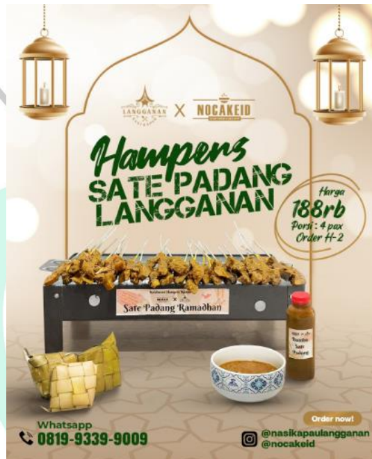
Gambar 2.3 Produk Kolaborasi dengan Nasi Kapau Langganan

kolaborasi antara Nocakeid dengan Jajan Madam yang dimiliki dan dikelola oleh aktris Fitri Tropica, kemudian Nocakeid juga berkolaborasi dengan Nasi Kapau Langganan yang dimiliki oleh aktor sekaligus penyiar radio yang cukup terkenal yaitu Kemal Mochtar.