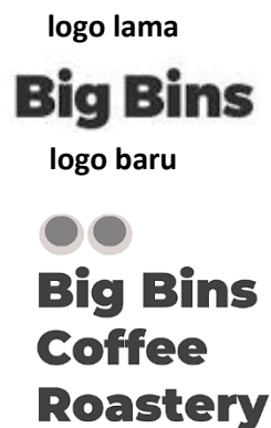
Gambar 2. 1 Profil Big Bins Coffee Roastery

Big Bins Coffee Roastery saat ini telah mengganti logo sebanyak 1 kali. Logo terbaru masih menggunakan konsep yang kurang lebih sama, hanya saja ada penambahan kata yaitu coffee roastery dan symbol dua bola buah mata. Penambahan kata coffee roastery dalam logo itu sekaligus memperkenalkan kepada masyarakat kalau big bins saat ini juga sudah menjadi pemasok beans dan roast beans. Simbol mata mengartikan mata yang segar karena minum kopi.