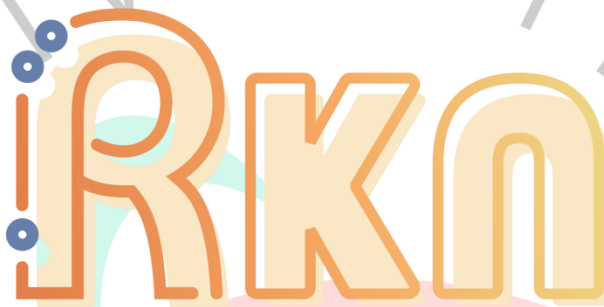
Gambar 2. 1 Logo Ruang Kolaborasi Nusantara