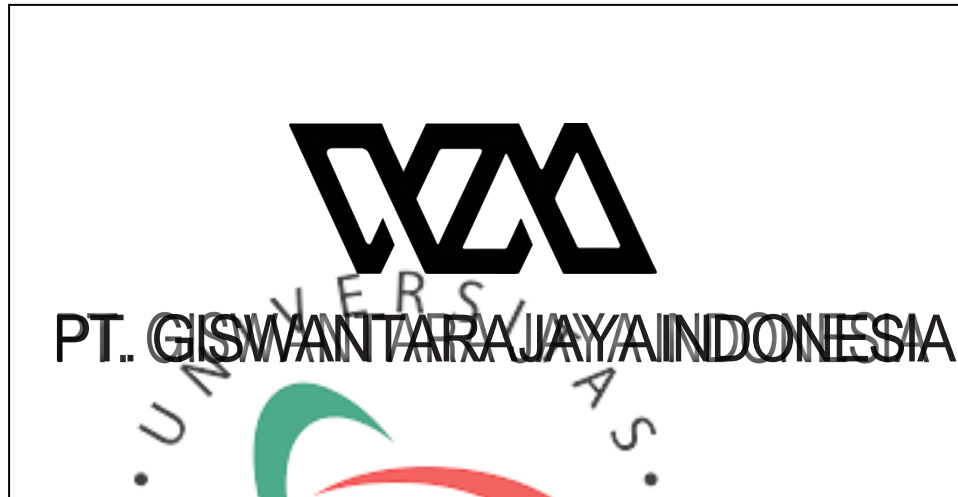
Gambar 2.1.1. Logo PT. Giswantara Jaya Indonesia

PT Giswantara Jaya Indonesia adalah perusahaan yang bergerak di bidang Food and Beverage. Perusahaan juga memiliki kegiatan di bidang ritel otomotif dan pakaian. Perusahaan ini didirikan pada awal tahun 2017 dan berlokasi di kawasan Bintaro, Jakarta Selatan. PT Giswantara Jaya Indonesia berawal dari UKM yang menjual pakaian dengan merek Weekend Mates.