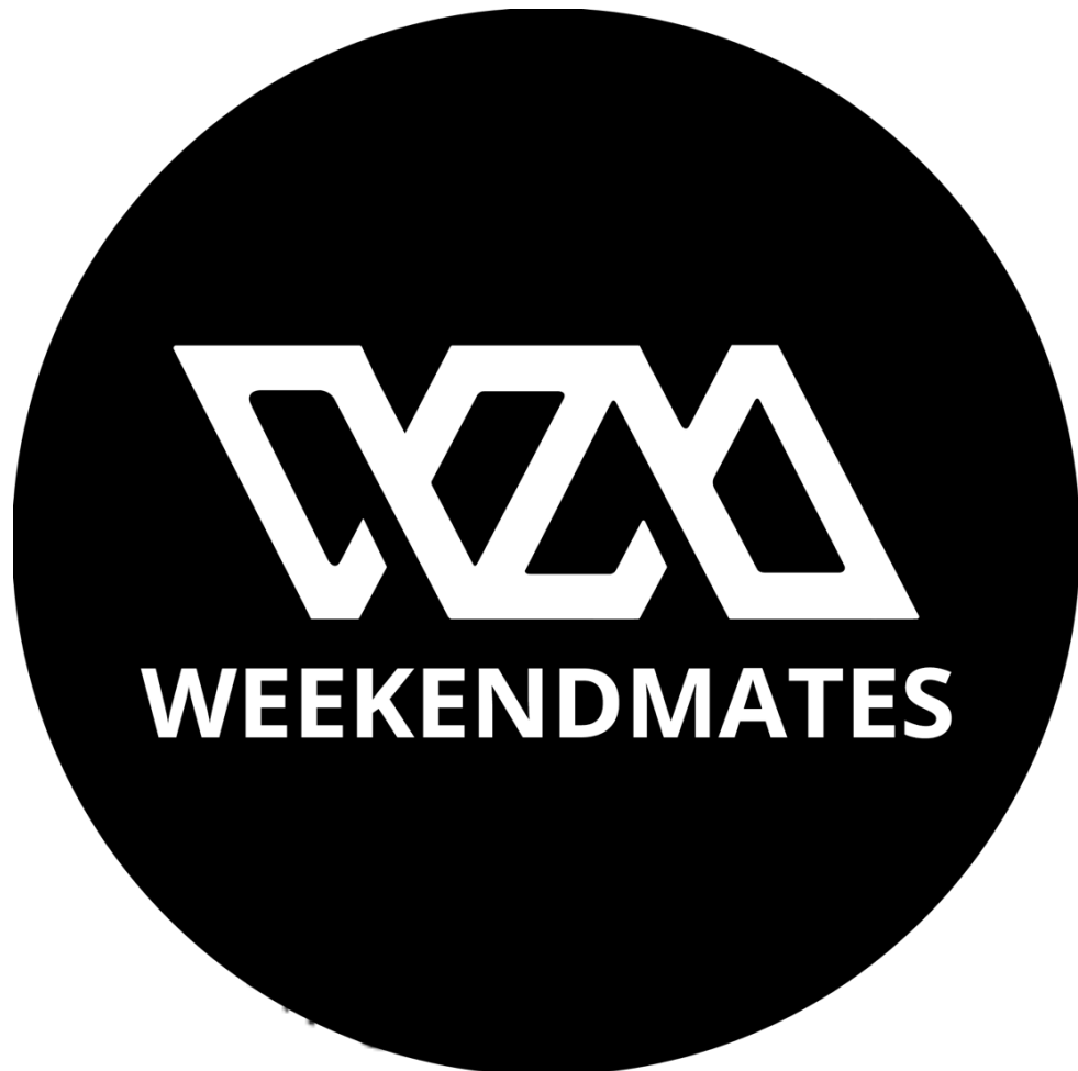
Gambar 2.1.2. Weekend Mates Apparel

Selanjutnya pada tahun 2019 perusahaan ini mengembangkan usahanya dibidang Makanan dan Minuman dengan nama Weekend Mates Coffee. Weekend Mates Coffee berlokasi di daerah Bintaro, Jakarta Selatan memiliki konsep dengan harga ekonomis sesuai dengan kantong di seluruh kalangan mulai dari kalangan bawah hingga kalangan atas, baik itu pelajar, mahasiswa, atau pebisnis. Saat pembukaan Weekend Mates