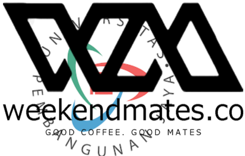
Gambar 2.1.3. Weekend Mates Coffee

Pada tahun 2021 perusahaan ini menjadi mendaftarkan usahanya menjadi Perusahaan Terbuka dengan nama PT. Giswantara Jaya Indonesia, dengan Nomor Induk Berusaha 0511210029569. Pada bulan Maret tahun 2022, PT. Giswantara Jaya Indonesia membuka cabang usaha Makanan dan Minuman baru di daerah Prapanca, Jakarta Selatan dengan nama Weekend Mates Cafe.