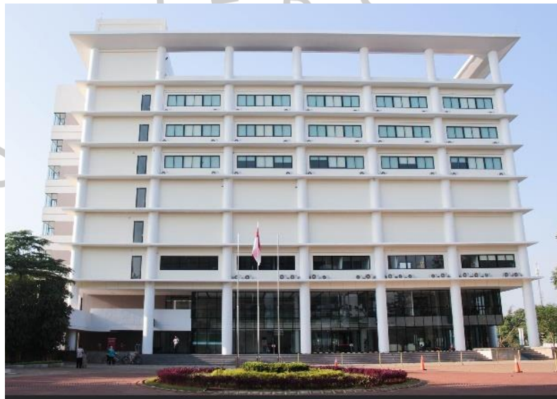
Gambar 2.1 Kampus Universitas Pembangunan Jaya Gedung A

Kampus Universitas Pembangunan Jaya adalah sebuah kampus swasta yang didirikan pada tahun 2011 dan didukung oleh kelompok usaha Pembangunan Jaya. Kelompok usaha Pembangunan Jaya memiliki 17 usaha dalam bidang property, manufaktur, konsultan manajemen, desain, dan lain-lain. Kelompok usaha Pembangunan Jaya sudah lebih dari 50 tahun berpengalaman dalam mengelola sektor usaha dan beritikad untuk mengabdikan sebagian dari kegiatan usaha induknya ke pendidikan dalam membangun sumber daya manusia yang lebih berkualitas.