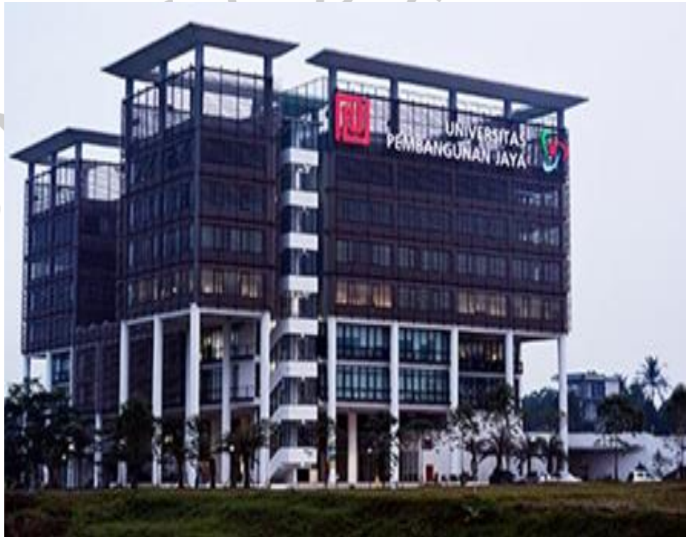
Gambar 2.1 Universitas Pembangunan Jaya

Universitas Pembangunan Jaya (UPJ) adalah sebuah perguruan tinggi swasta di daerah Bintaro yang berdiri pada tahun 2011 dan didukung oleh kelompok usaha Pembangunan Jaya. Kelompok usaha Pembangunan Jaya memiliki 17 usaha yang bergerak dibidang properti, manufaktur, konsultan manajemen, konsultan desain, kontraktor, pariwisata/rekreasi, trading , mekanikal & elektrikal dan pendidikan. Kelompok usaha Pembangunan Jaya memiliki pengalaman lebih dari 50 tahun dalam mengelola sektor usaha dan beritikad untuk mengabdikan sebagian dari kegiatan usaha induknya ke pendidikan dalam membangun sumber daya manusia Indonesia yang lebih berkualitas. Itikad ini, telah diwujudkan dengan mendirikan Yayasan Pendidikan Jaya sejak 3 September