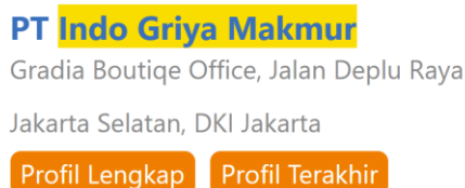
Gambar 2.1 Bukti AHU PT Indo Griya Makmur