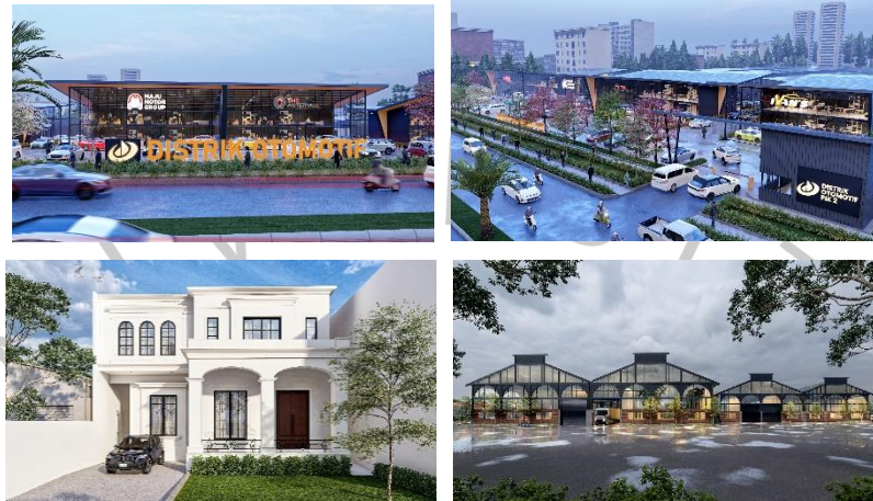
Gambar 2. 3 Contoh Desain PT Herindo Konsultan Perencana

Superimpose Arsitektur. proyek PT. Herindo Konsultan Perencana terpaut dengan proyek rumah tinggal, Gudang, maupun Highrise. Berikut contoh proyek yang dilakukan PT. Herindo Konsultan perencana: