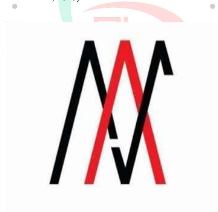
Gambar 2.1 Logo PT. Ananta Mitra Selaras