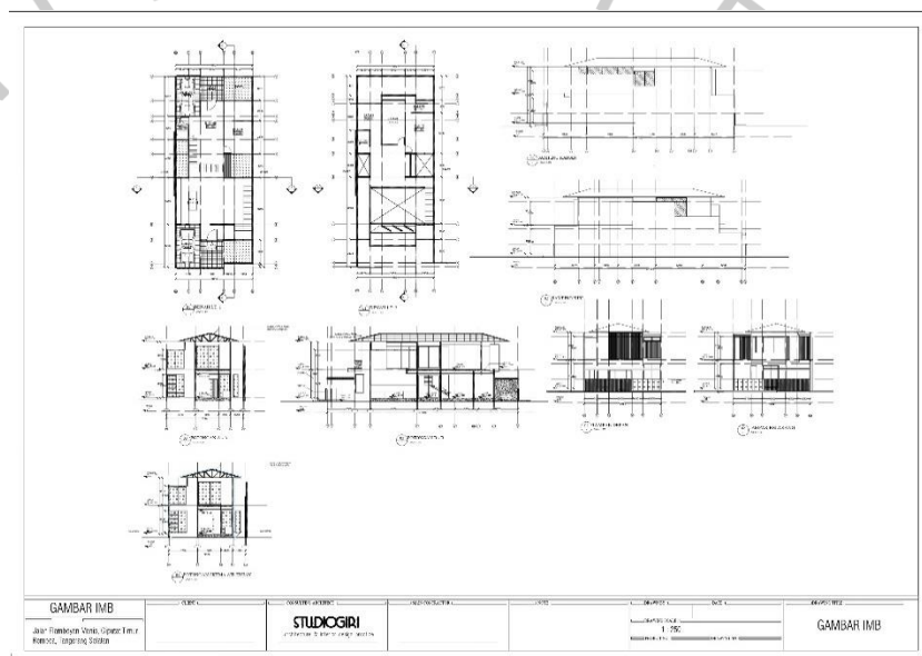
Gambar 2. 4 Gambar Kerja IMB Proyek Rumah Tinggal Bu Ratna, Kucica