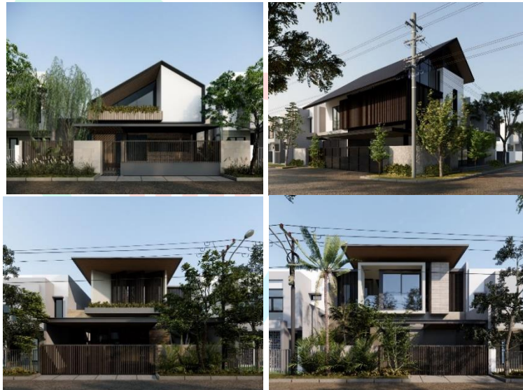
Gambar 2. 3 Contoh Desain Studiogiri