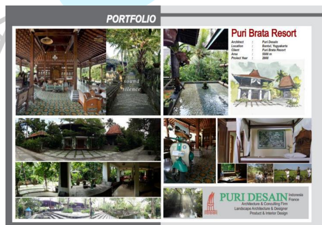
Gambar 2. 1. Profil CV. Puri Desain Indonesia CV. Puri Desain Indonesia (2023)

Pada perancangannya Puri Desain sangat menghargai setiap warisan budaya dan sejarah masa lalu sebelum mengembangkan ide dan karya sebagai pondasi dibangunnya Puri Desain. Puri Desain memiliki jaringan Asosiasi yang terletak di Yogyakarta, Jakarta, hingga Paris, dengan mitra-mitra yang bekerja sama dari berbagai bidang lainnya seperti global issue , dan pariwisata.