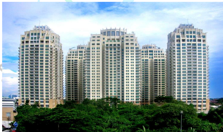
Gambar 2.5 Apartement Pakuwono