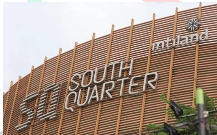
Gambar 2.4 South Quarter