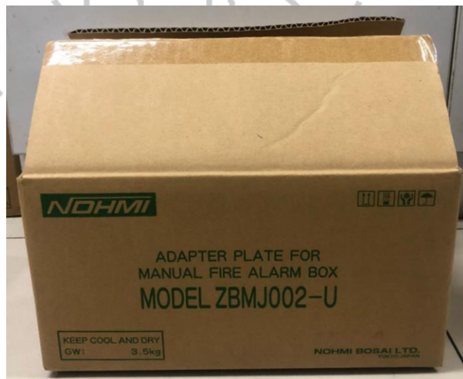
Gambar 2.14 Fire Alarm Nohmi

Nohmi merupakan sebuah nama merk produk barang yang bergerak di bidang fire alarm. Produk Nohmi sudah di percayai oleh PT Jaya Teknik Indonesia karena produk tersebut dalam kualitas produknya cukup baik dan telah mengalami beberapa pengujian, pengujian tersebut supaya produk tersebut banyak diminati oleh perusahaan. Dengan adanya produk Nohmi PT Jaya Teknik Indonesia banyak yang memanfaatkan barangnya untuk di distribusi. Berikut produk Nohmi :