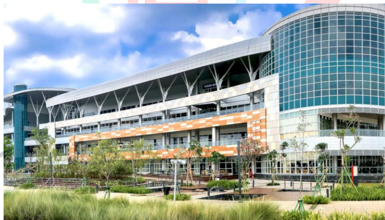
Gambar 2.7 Mall Bintaro Xchange