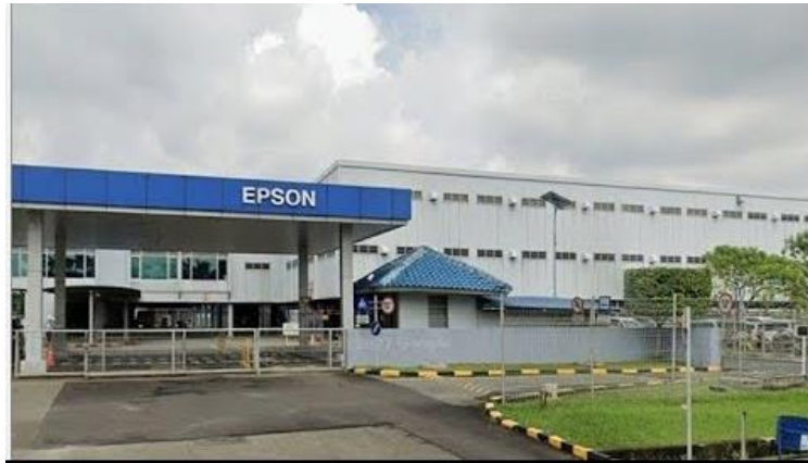
Gambar 2.10 Indonesia Epson Factory