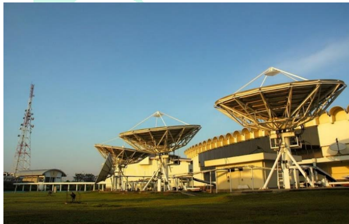
Gambar 2.8 Palapa Master Control Station