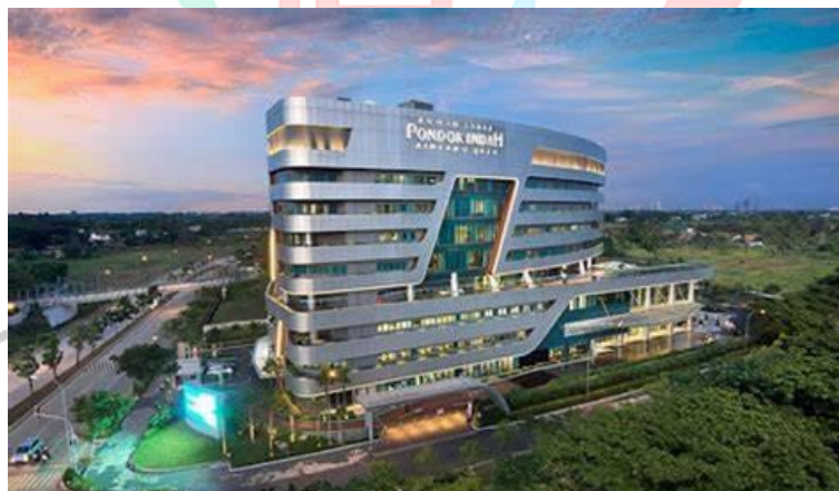
Gambar 2.6 Rumah Sakit Pondok Indah