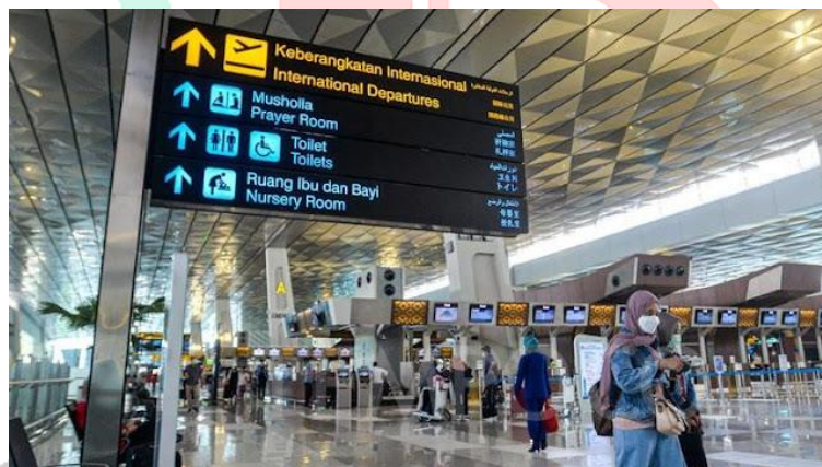
Gambar 2.3 Bandara Soekarno Hatta