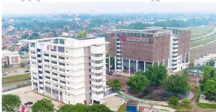
Gambar 2.11 Universitas Pembangunan Jaya