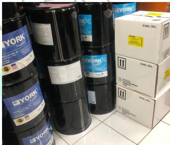
Gambar 2.12 Produk Oil York

York merupakan sebuah nama merk produk barang yang bergerak di bidang Oil & Sparepart untuk pendingin seperti Air Conditioning, Chiller dan Cooling Tower. PT Jaya Teknik memilih produk YORK di karenakan untuk kualitas barangnya sangat bagus dan banyak diminati oleh perusahaan. Berikut adalah contoh material produk dari York sebagai berikut: