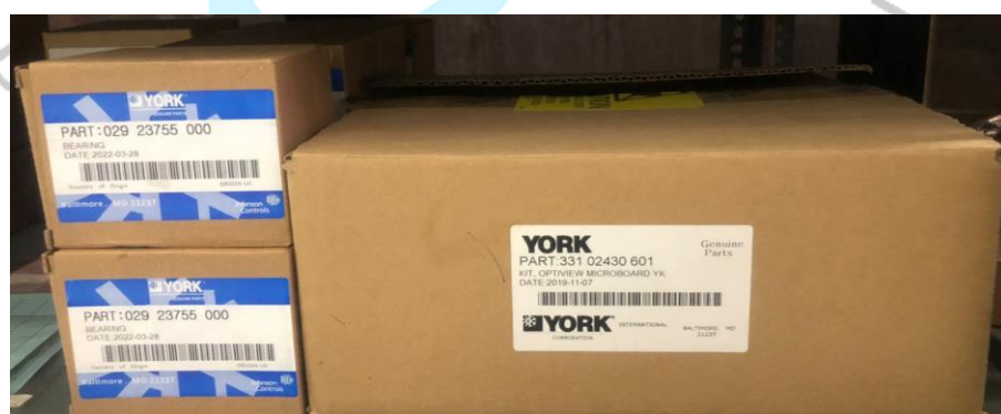
Gambar 2.13 Sparepart York