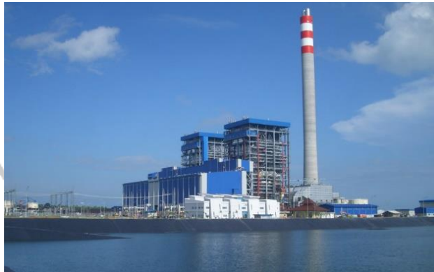
Gambar 2.9 Steam coal power plant 2x300 MW Rembang, Jawa Tengah