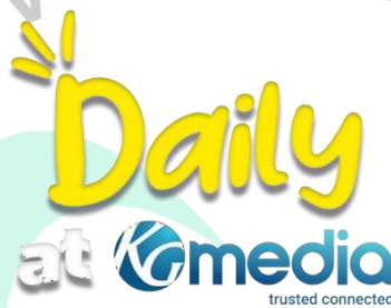
Gambar 2. 3 Logo Daily at KG Media

halaman media sosial Instagram Daily at KG Media ada beberapa konten video yang dibuat dan di edit oleh praktikan. Rata-rata postingan yang berupa di laman Instagram Daily at KG Media merupakan sejumlah kegiatan yang dilakukan oleh beberapa karyawan KG Media seperti contoh beberapa kunjungan Bupati atau Walikota dari beberapa daerah yang berkunjung ke Kompas Gramedia atau Kompas TV yang di dampingi langsung oleh salah satu pemimpin dari Public Relations KG Media dan beberapa kegiatan internal karyawan Kompas Gramedia seperti Best Employe atau konten menarik lainnya.