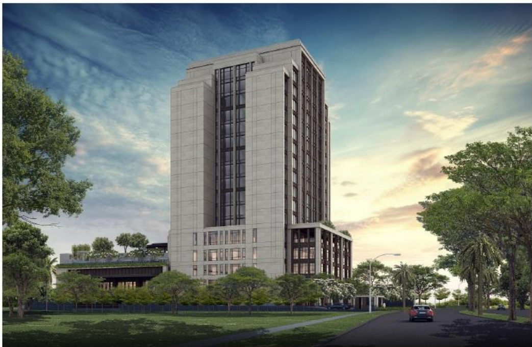
Gambar 1. 2 Ilustrasi Hasil Proyek Hotel Tentrem Jakarta-Alam Sutera