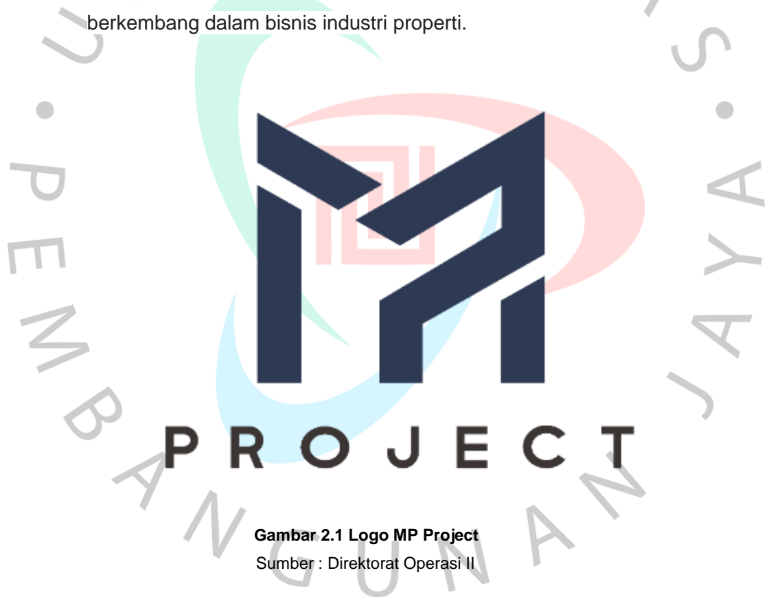
Gambar 2.1 Logo MP Project

MP Project merupakan holding company (induk) yang berdiri sejak tahun 2017. Perusahaan ini memiliki fokus pada pengembangan, pengelolaan, dan pembangunan properti. Pada awalnya, Perusahaan ini meluncurkan proyek perumahan bernama “Kenanga Townhouse” yang bertempat di Kemang, kota Jakarta Selatan. Proyek tersebut telah sukses dikerjakan dan menjadi motivasi bagi pihak perusahaan untuk terus berkembang dalam bisnis industri properti.