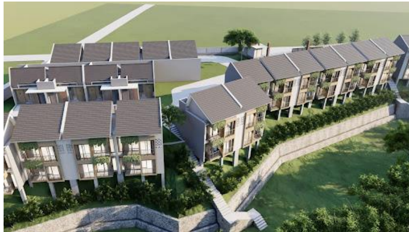
Gambar 2.2 Skema Alpen Hills Residence