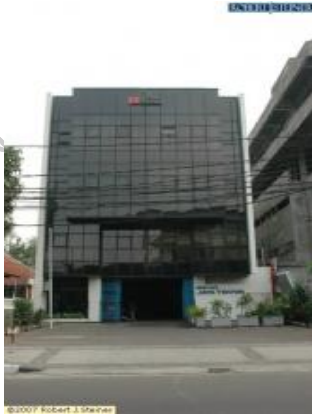
Gambar 2. 1 Perusahaan PT Jaya Teknik Indonesia

Group telah berkembang dengan mengakuisisi sejumlah bisnis dan memperluas cakupannya hingga dikenal sebagai otomasi industri Jaya.