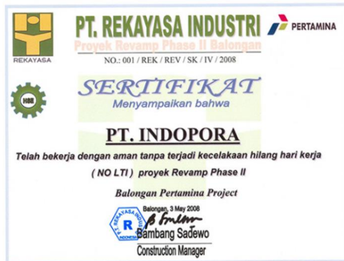
Gambar 2 2 Sertifikat Penghargaan PT. Indopora Tbk