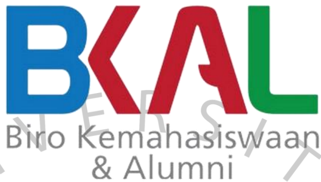
Gambar 2. 2 Logo Biro Kemahasiswaan dan Alumni

memberikan kontribusi yang nyata bagi bangsa (Blro Kemahasiswaan dan Alumni, 2023)