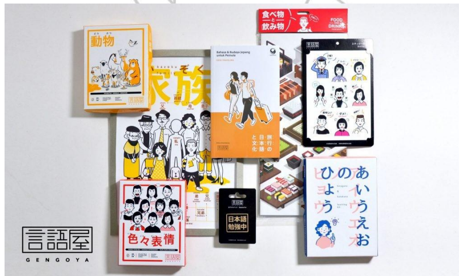
Gambar 2.3 Proyek Gengoya

Gengoya merupakan suatu platform pembelajaran bahasa Jepang yang menyatukan kosakata dan ilustrasi. Gengoya dapat memotivasi individu untuk mempelajari bahasa Jepang dan membantu pengguna dalam memperluas kosakata mereka sambil mendapatkan pengalaman yang menyenangkan, melalui penerapan strategi omnichannel yang sesuai dengan tuntutan masyarakat modern.