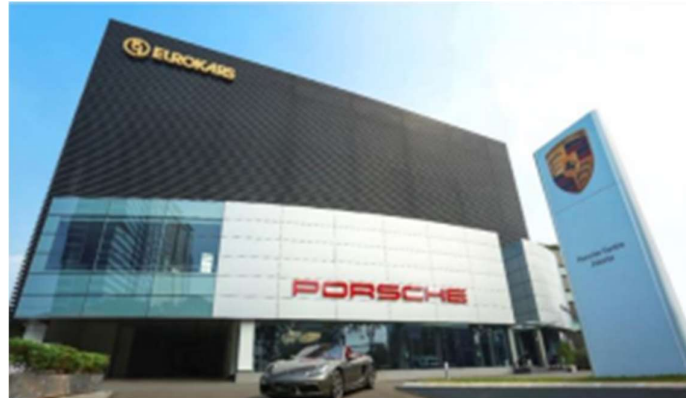
Gambar 2. 1 Gedung Eurokars Centre Jakarta