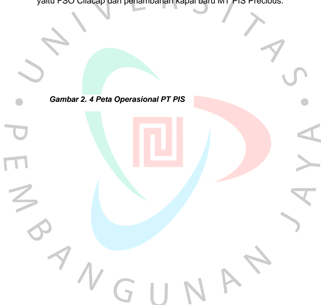
Gambar 2. 4 Peta Operasional PT PIS

Sampai dengan akhir tahun 2022, PT PIS telah mengelola 95 kapal tanker dengan berbagai variasi tipe muatan dan ukuran kapal. Dimana pada akhir 2022, PT PIS telah melakukan scrap pada salah satu kapalnya yaitu FSO Cilacap dan penambahan kapal baru MT PIS Precious.